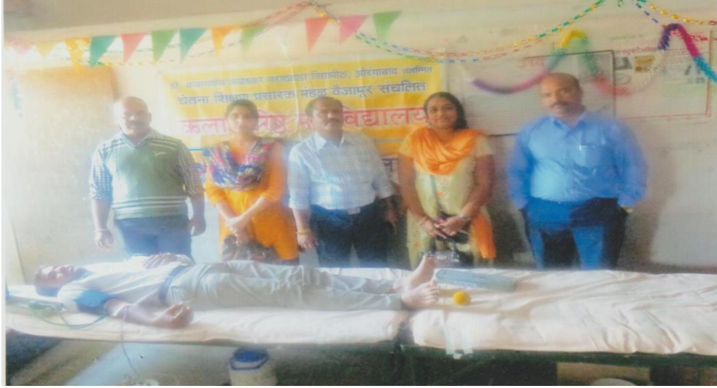
Blood Donation Camp (2016-17)