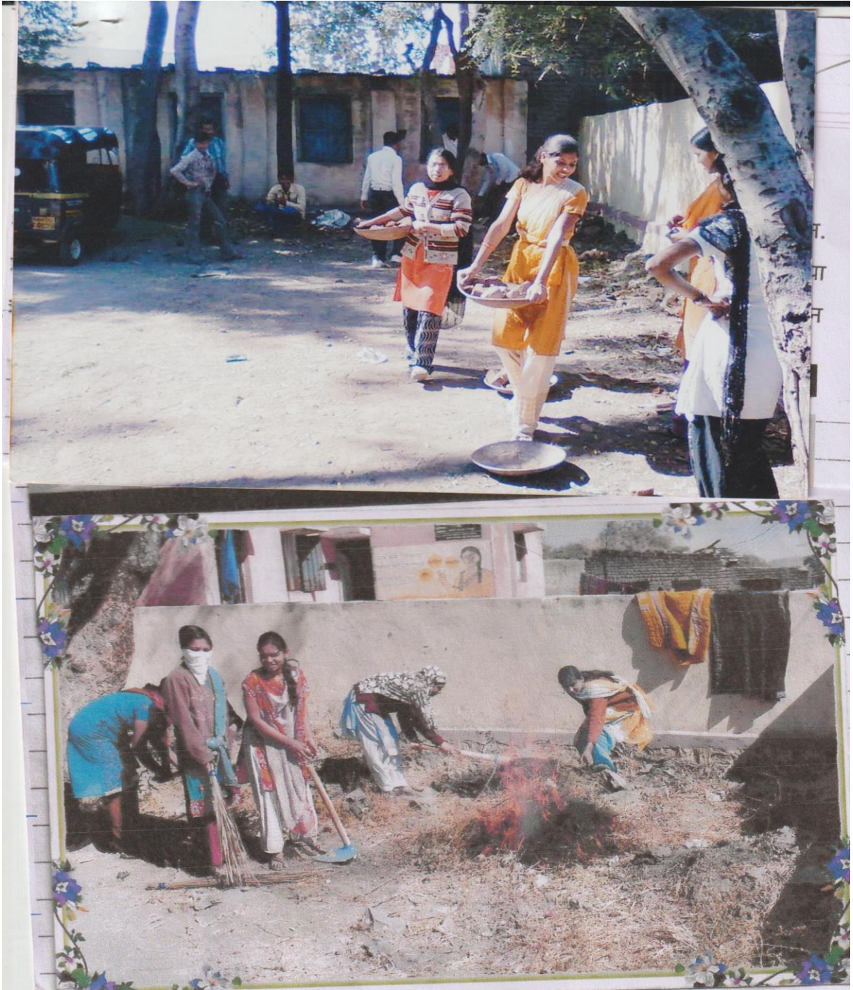
Mission Cleanness Program (2016-17)