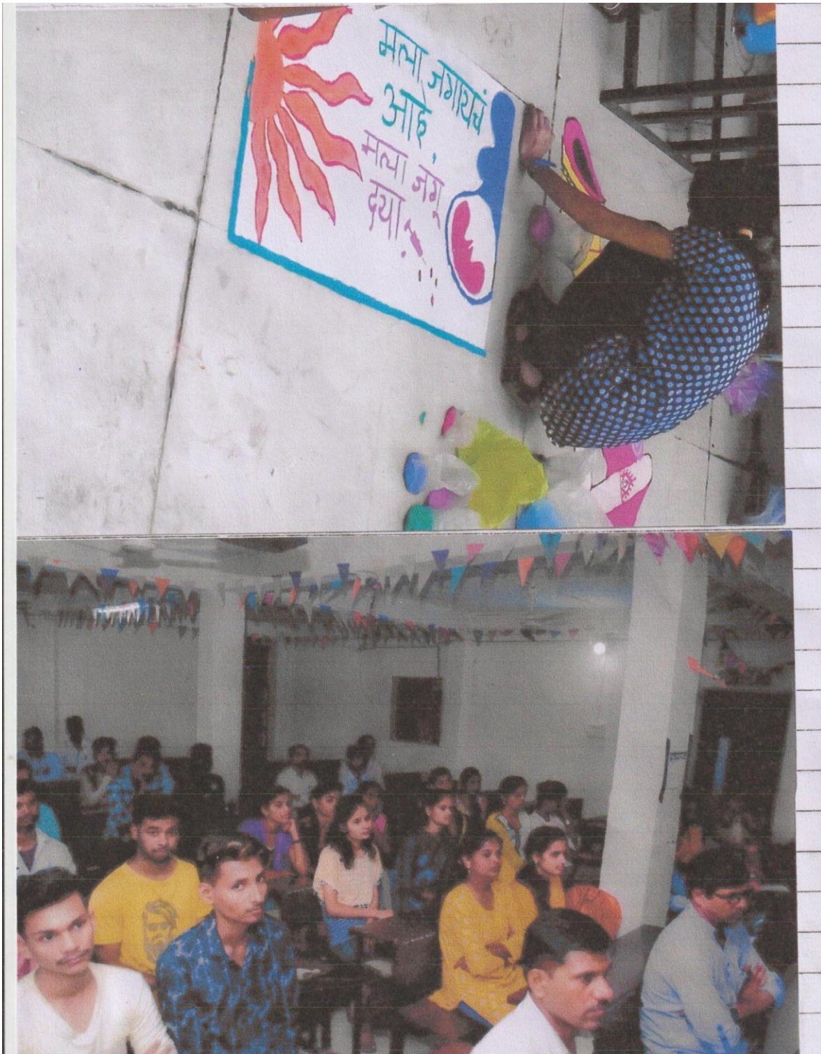
Gender Equality Program (2016-17)