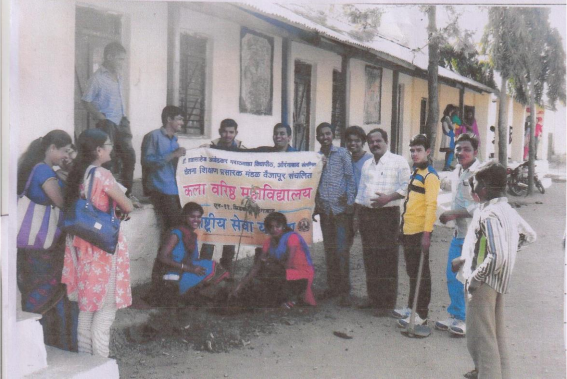
Tree Plantation Dated 01/07/2016 (2016-17)