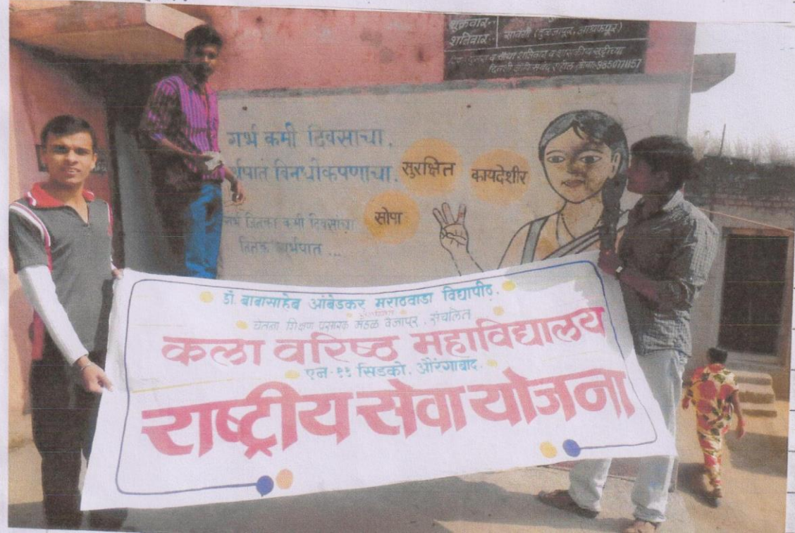
AIDS day programe dated 01/12/2016 (2016-17)