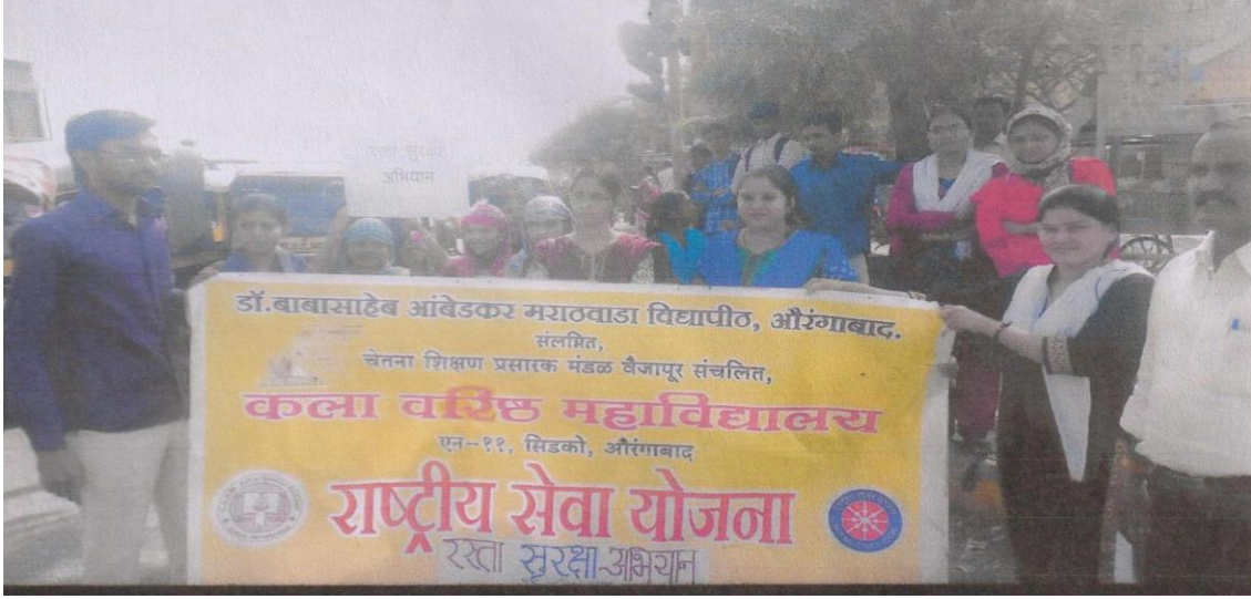
Mission Road Safety Rally Dated 04/01/2017 (2016-17)